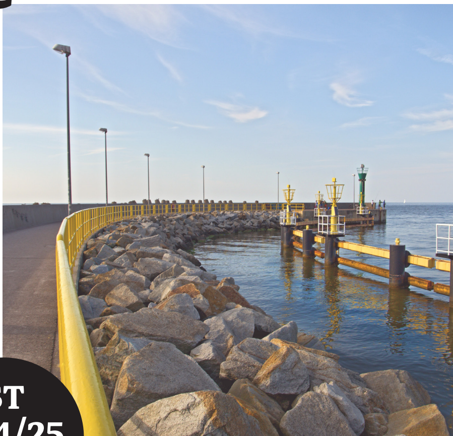
Na fotografii Leba, Polsko.

počítačová studovna Vědecké knihovny UJEP